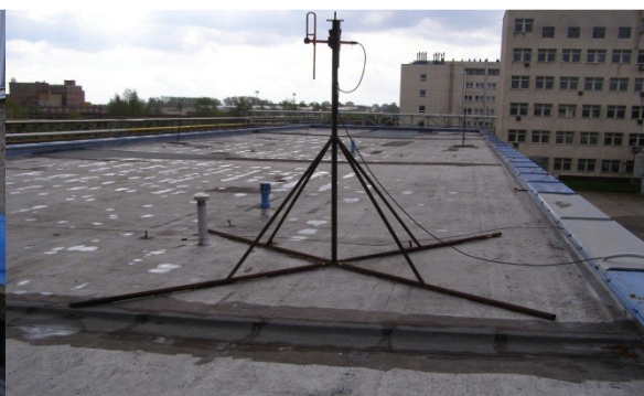
Obrázek č. 2 – střecha C5440