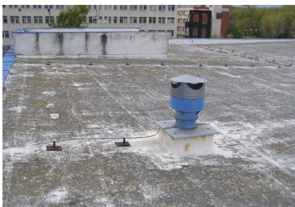
Obrázek č. 3 – C5480