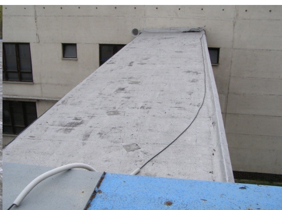
Obrázek č. 4 – spojovací tunel