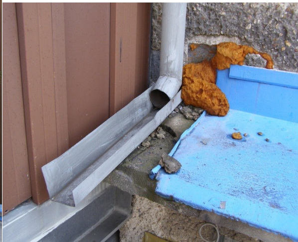
Obrázek č. 6