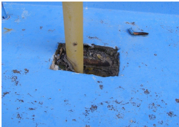
Obrázek č. 7