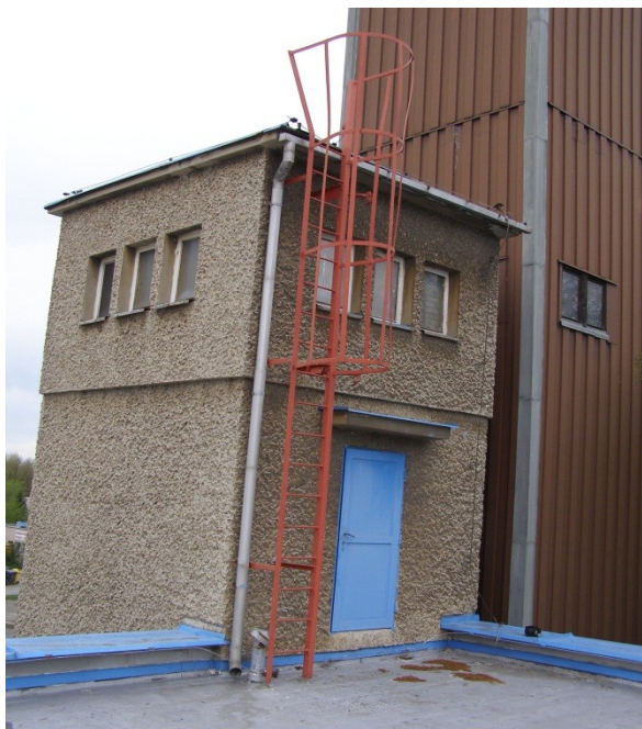
Obrázek č. 5