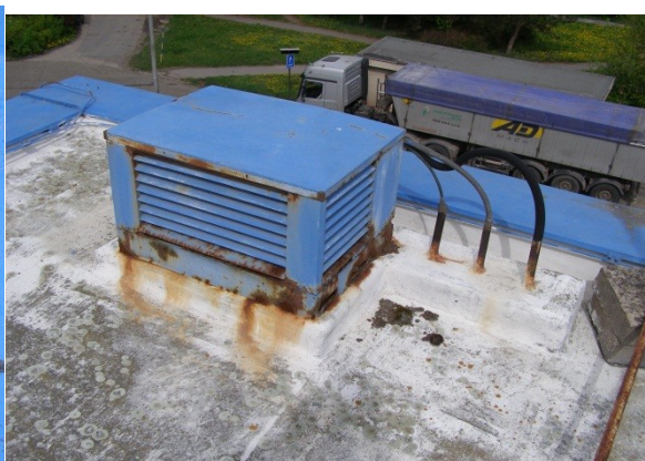
Obrázek č. 8