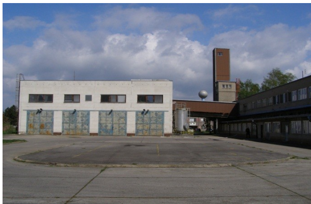
Pohled na objekt C5480