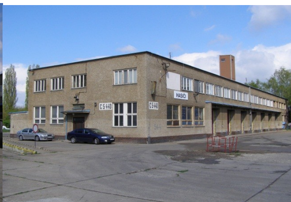
Pohled na objekt C5440