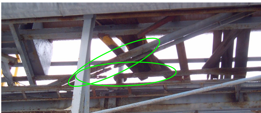
Foto 9 : prokorodovaná L výztuha lávky mezi sloupy 2 a 3 a podpora lože potrubí